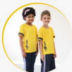
ENSINO FUNDAMENTAL I: CAMISETA AMARELA