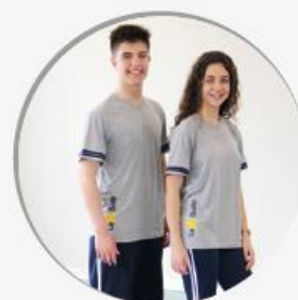
ENSINO MÉDIO: CAMISETA CINZA