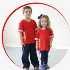
EDUCAÇÃO INFANTIL: CAMISETA VERMELHA