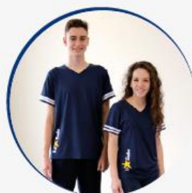
ENSINO FUNDAMENTAL II: CAMISETA AZUL